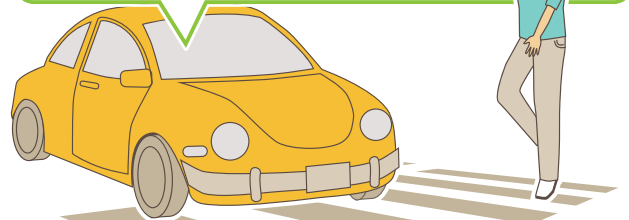
図1：車と横断歩道を横断中の歩行者との死亡事故を法令違反別にみた割合（平成28年中）