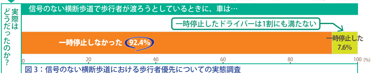
図3：信号のない横断歩道における歩行者優先についての実態調査