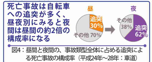
図4：昼間と夜間の、事故類型全体に占める追突による死亡事故の構成率（平成24年～28年：車道）