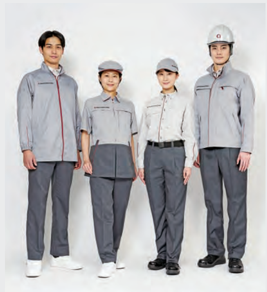
左から清掃制服ウィンドブレーカー、清掃制服チュニック、技術制服通年シャツ、技術制服秋冬用