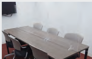
アクリル板の設置