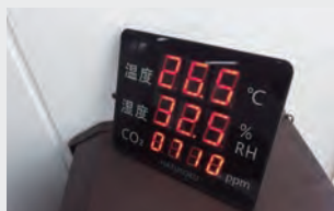
二酸化炭素濃度計