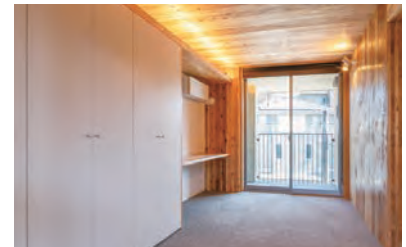
国産CLT*を使用した社員寮 *Cross Laminated Timber: 直交集成板