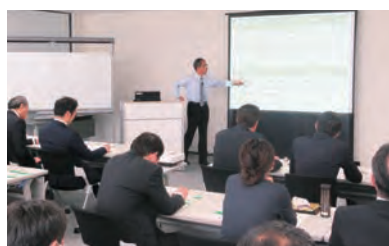
外部講師によるハラスメント防止研修