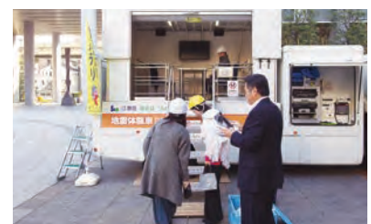
起震車を用いた訓練への参加