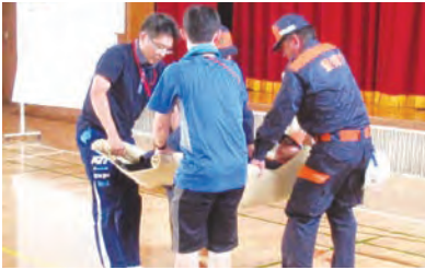
福祉避難所開設訓練への参加