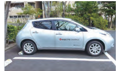
低公害車 (EV) の導入