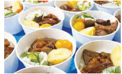
子ども食堂の運営協力