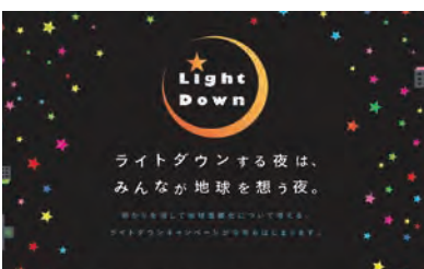
ライトダウンキャンペーンへの参加