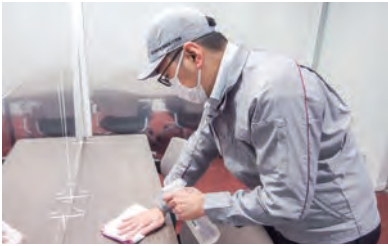
管理建物における感染防止対策