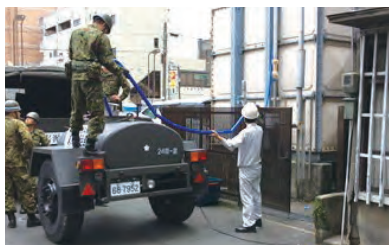
自衛隊復旧活動への協力