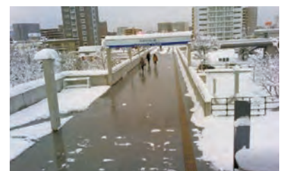
ロードヒーティングのエネルギー消費量削減