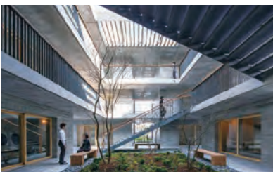
コミュニケーションを誘発するレイアウトの社員寮