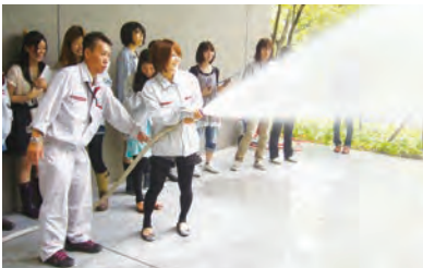
フィールドワークの受け入れ