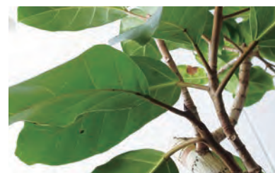
来院者向けグリーンセラビーへの協力